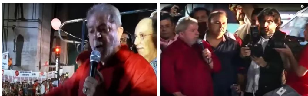
Figura 1 – Lula e a resistência ao golpe Fonte: fotogramas do filme Excelentísimos .

Em Excelentísimos , também observamos imagens de arquivo do Instituto Lula e do canal TVT 2 (entre 39min21s e 40min52s). O então ex-presidente aparece diante das câmeras em um dos comícios contra o golpe. A primeira cena da sequência mostra um plano aéreo que intensifica a dimensão do evento. Para tanto, a montagem utiliza primeiros planos de Lula, que profere à militância um discurso emblemático de defesa da ação política e social, além de mostrar as reações eloquentes do público ao discurso de Lula em planos gerais.