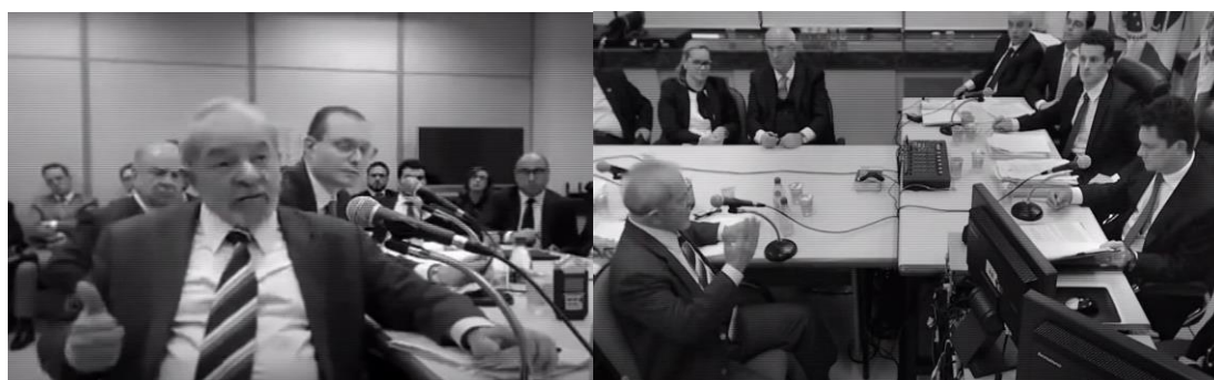
Figura 3 – Lula vs. Moro: afirmação de inocência e consciência da imagem histórica. Fonte: fotogramas do filme Amigo secreto .

realiza sua crítica à forma como o Ministério Público e a Polícia Federal conduziam as investigações. Sobretudo, está consciente da presença da câmera e não hesita em olhar para ela de maneira afirmativa ao denunciar os excessos da Operação Lava Jato (primeira sequência entre 1min45s e 6min36s; segunda sequência entre 28min20s e 29min37s).